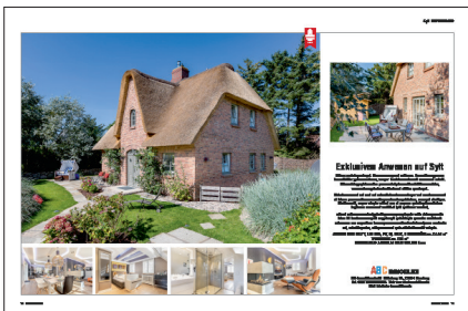
Doppelseite € 2.950*

Mit den Galerie-Präsentationen bietet BELLEVUE die Gelegenheit, jeweils eine besondere Immobilie in einem adäquaten, großzügigen Umfeld zu präsentieren.