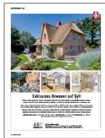
Ganze Seite € 1.590*