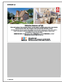
1/2 Seite € 980*